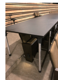
専用机 W1800 x D1100